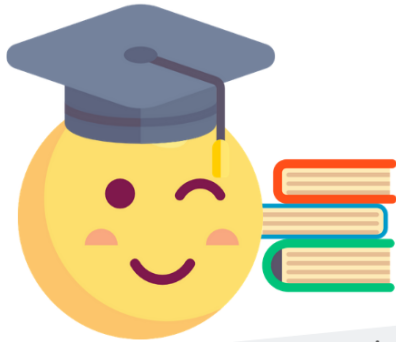
Zdolność do samodzielnego uczenia się